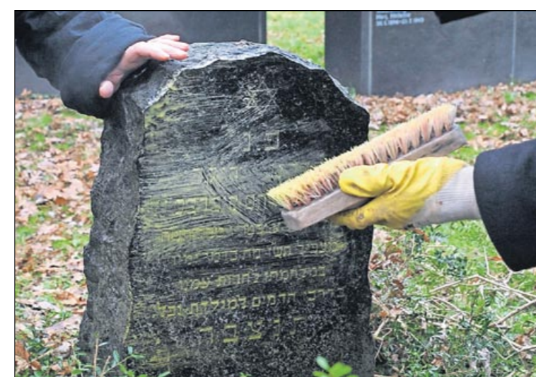
Spurensuche: Der Grabstein wird gereinigt.