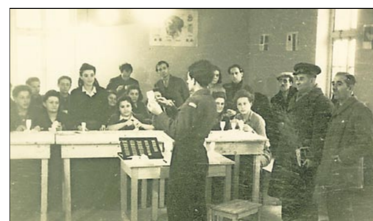
Unterricht im Kasernenblock: Die Exodus-Juden bereiteten sich in Emden auf ihre Ausreise nach Palästina vor.